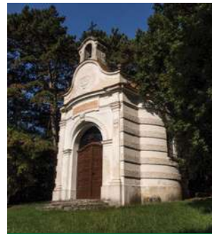
Die Kapelle der Hl. Vendelin dominiert bis heute dem Friedhof

Zu den wertvollen Sehenswürdigkeiten von Smolenice gehört Die Maria-Geburt-Kirche. Sie steht an einem ruhigen Platz, auf der Anhöhe über der Gemeinde, eingeklemt von mehr als dreihundertjährigen Linden. Sie entstand auf den Grundlagen der ursprünglichen gotischen Kirche. Hinter dem großen Umbau im Jahre 1642 stecken sich Gabriel Erdödy und seine Ehefrau Maria Pálfi. Einfaches Exterieur im Renaissancestil mit Resten der gotischen Architektur und mit herrlich verziertem Portal kontrastiert mit der frühbarocken Dekoration des Interieurs.