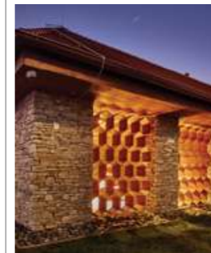
Besuchen Sie die Honigweinproduktion Včelco und nutzen eine Möglichkeit der Kostprobe

Sieben Rebenmesser und das Tongefäß für Wein aus der Burgstätte Molpír sind die materiellen Zeugen der althergebrachten Verknüpfung dieser Weinkultur. Schon im Jahre 1401 gab es in der Gemeinde vierzehn Weinberge! Die Bewohner von Smolenice verkauften ihren Wein direkt aus dem Hof – „unter Buschenschank“. Diese Häuser wurden mit dem Kränzchen aus dem Weinbergblatt oder mit dem Bukett bezeichnet. In geheimen Räumen der Weinkeller versteckten die Winzer sogar ihre Produkte vor Finanzkontrolle.