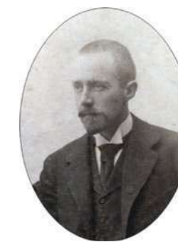
Der Graf Josef Pálfi (1853 – 1920) Patron der Gemeinde Smolenice

Das Gebiet von Smolenice wurde seit dem 6. Jahrhundert vor Kristi besiedelt. „Der Armvoll“ der Kleinen Karpaten und später auch die Reihe der mittelalterlichen Festungen, deren Bestandteil seit dem 13. Jahrhundert auch Schloss Smolenice war, beschützten strategisch dieses Gebiet. Ursprünglich erstreckte sich die Gemeinde in sogenannten „Gemeindebergen“ nördlich von damaliger Burg. Diese wurden generell seit den Urzeiten eine wichtige Quelle des Steins, Holzes und Kalks, der nicht nur für die hiesigen Einwohner, sondern auch für Trnavaer Bürger diente.