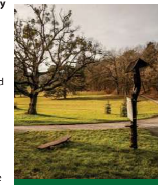
Der Ausgangspunkt der mehreren Touren ist Englischpark

Distance: 6,5 km, Difficulty: easy, Duration: 2,5 hours.