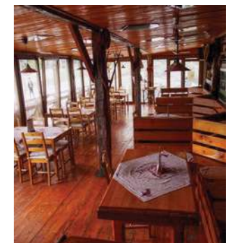
Innenraum des Restaurants Havran Pub

Das echte bäuerische Restaurant mit dem Angebot von leckeren hausgemachten Spezialitäten und mit einem Sommergarten.