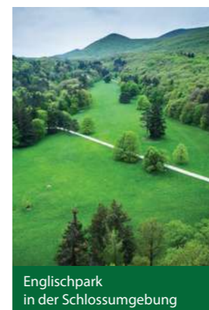
Englischpark in der Schlossumgebung