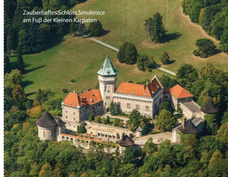
Zauberhaftes Schloss Smolenice am Fuß der Kleinen Karpaten