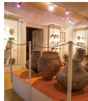
Archäologische Funde aus der keltischen Burgstätte Molpír

Das berühmte Landeskind aus Smolenice Štefan Banič (1870-1941) hat sich mit der Erfindung des Fallschirms während seines Lebens in USA berühmt. Dorthin zog er im Jahre 1907 wegen der Arbeit um. Zur Herstellung des Fallschirms, mit dem er die Leben der Piloten retten wollte, motivierte ihn der Flugzeugunfall, dessen er der Zeuge war. Er probierte den Fallschirm selbst mit dem Sprung von dem fünfzehn Meter hohen Gebäude – und damit gewann er wertvolles Patent. Dieses hat er jedoch vor seiner Rückreise in die Heimat der US-Armee verkauft.